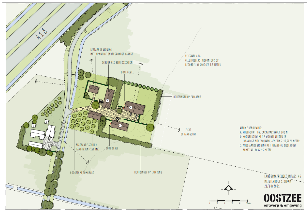
Inrichtingsschets nieuwe situatie

Onderstaand is beoogde erfinrichting weergegeven. Voor de nieuwe situatie is ieder geval van belang dat er sprake is van één compact en gezamenlijk erf waar de woning en de wooneenheden met de voorzijde op zijn georiënteerd. De inrichtingsschets voorziet in maximaal één toegangsweg op de Meisterholt die alle woningen in de nieuwe situatie via het gemeenschappelijke erf ontsluit.